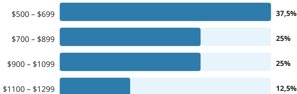
Gráfico 1. Distribución Salarial

El gráfico muestra que existe mayor concentración en salarios de $500 a $699, lo que es consistente con el perfil de graduados recientes que se incorporan al mercado laboral, y sugiere oportunidades de mejora en empleabilidad de mayor valor agregado a corto y mediano plazo.