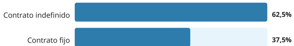
Gráfico 2. Tipo de contrato

Existe una alta proporción de contratos indefinidos (62,5%) lo que indica buena estabilidad laboral inicial. Sin embargo, más de un tercio (37,5%) aún presenta condiciones temporales.