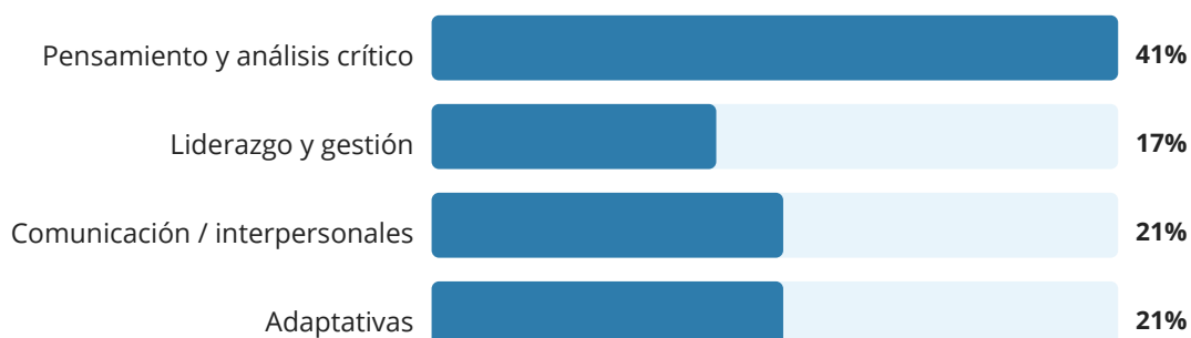
Gráfico 6. Competencias percibidas