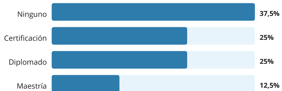
Gráfico 5. Estudios de posgrado

El 62,5% de los encuestados continúa sus estudios. Existe un predominio de diplomados y certificaciones, lo que refleja enfoque práctico y de corto plazo.